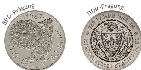
750 Jahre Berlin