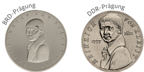
Heinrich von Kleist