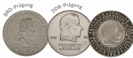
Friedrich von Schiller