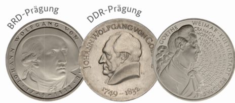
Johann Wolfgang von Goethe